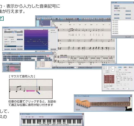
[マウスで音符入力]

外部のMIDI楽器やコンピュータのキーボードのキーを押して、また、キーボード / ギターフレット・ウィンドウをマウスのクリックで、1音1音確実に音符を入力。